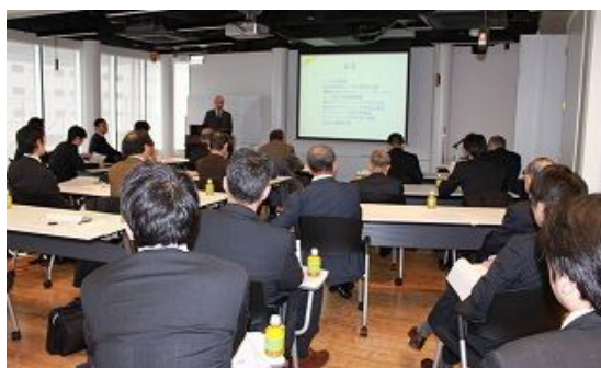
講演会(講演者と聴衆)