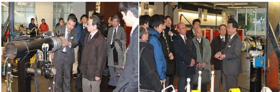
実験場見学(愛知産業株式会社)